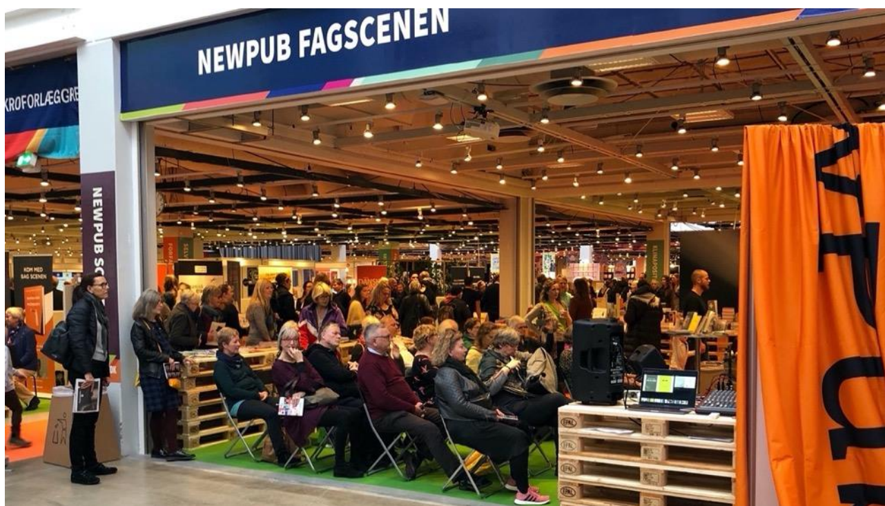
FRA NEWPUBS STAND PÅ BOGFORUM 2019

Sponsorbeløbet betales ved afgivelse af bindende tilmelding.